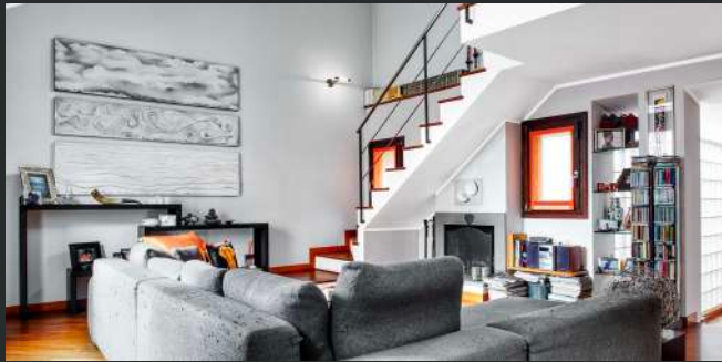
Zona Carrobbio, 240 mq. € 1.950.000,00