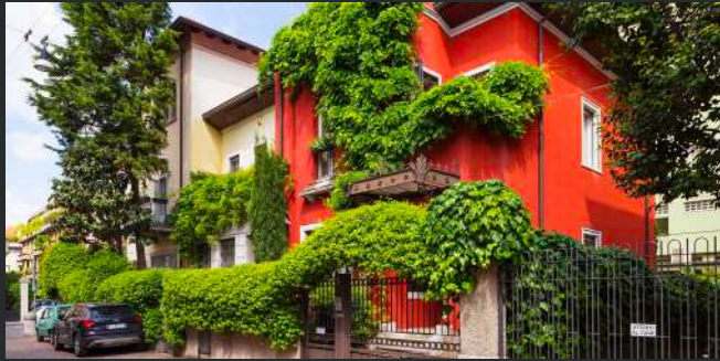
Zona 5 Giornate, 320 mq. € 2.500.000,00