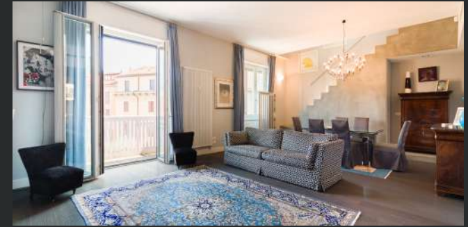
Zona Brera, 130 mq. € 1.390.000,00