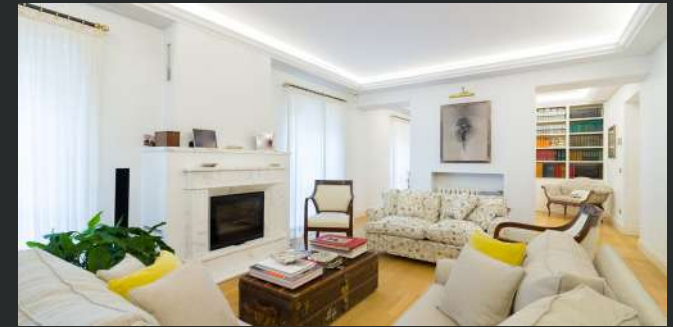
Zona Porta Venezia, 260 mq. € 1.490.000,00