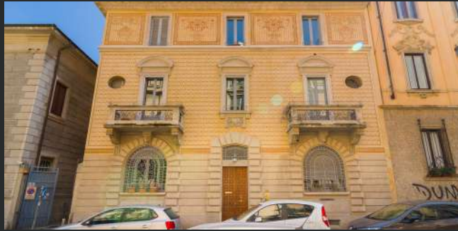
Zona Arco della Pace, 175 mq. € 1.730.000,00