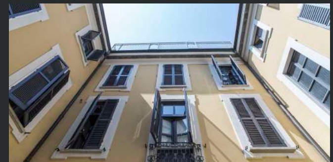
Zona Via Spiga, 160 mq. € 1.750.000,00