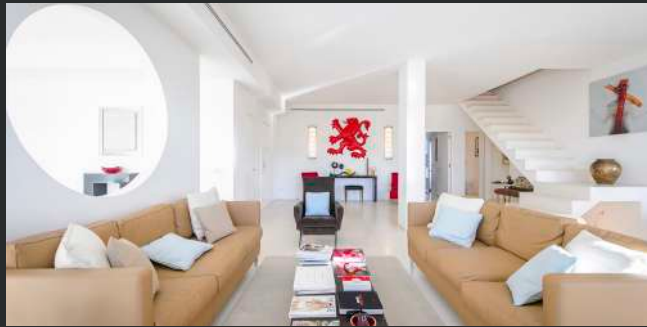
Zona Porta Venezia, 250 mq. € 1.800.000,00